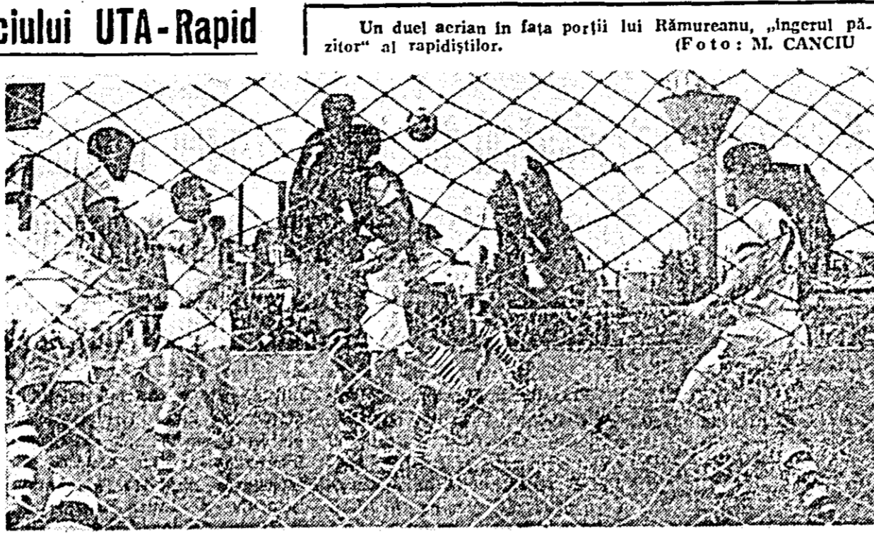
Un duel aerian în fața porții lui Rămureanu, „ingerul păzitor” al rapidiștilor.

Main article text describing the football match between UTA and Rapid.