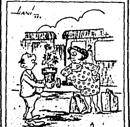
Dragul meu, ai fost totdeauna atent, dar de data asta nu crezi că exagorezi puțin?

Deși grădinile și serolele sint inundate de flori în toate culorile și de toate soiurile, adeseori florările din orașul nostru sint sărace aprovizionate cu flori, oferind în schimb ghivece de diferite mărimi, dar cu aceeași flori monotone.