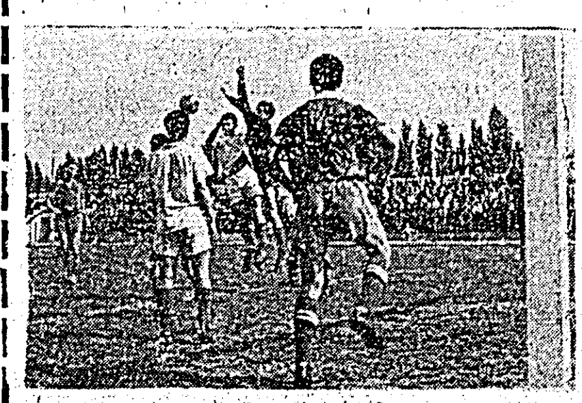
ÎN CLISEU: O fază palpitantă din întâlnirea de divizia B CFR Arad - Metalul Tr. Severin.