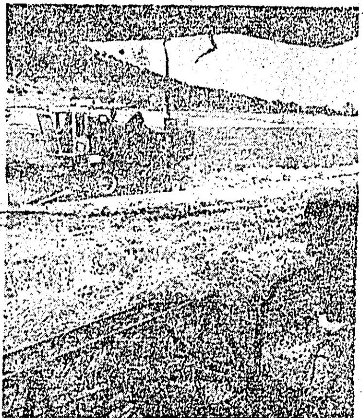
În lanurile cooperativei agricole de producție din Mocrea recoltatul grîului a debutat și continuă cu spor.