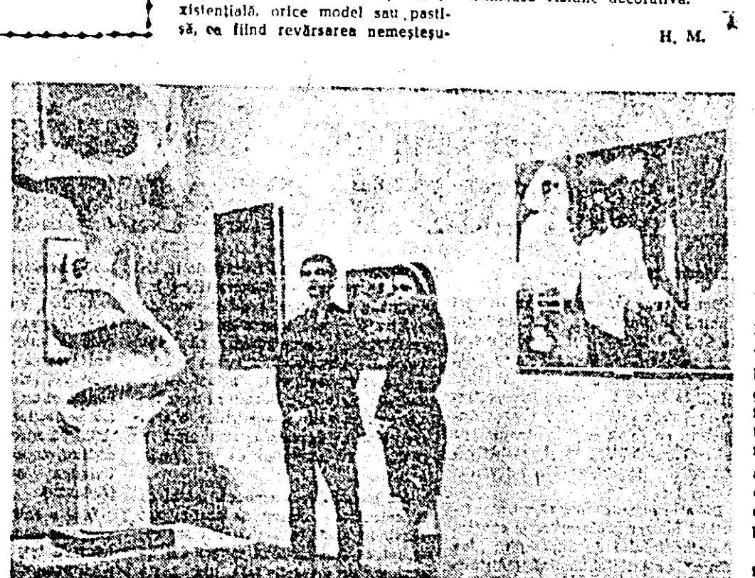
În cadrul mani- festărilor: prile- juite de Festiva- l „Primăvara a- rădeană '73” la Muzeul Județean a fost deschisă expoziția „Artă plastică arădea- nă” contemporană.”

La „Tricolor roșu”: 125 de ani de la revoluția burghezo-democratică din Țările Române