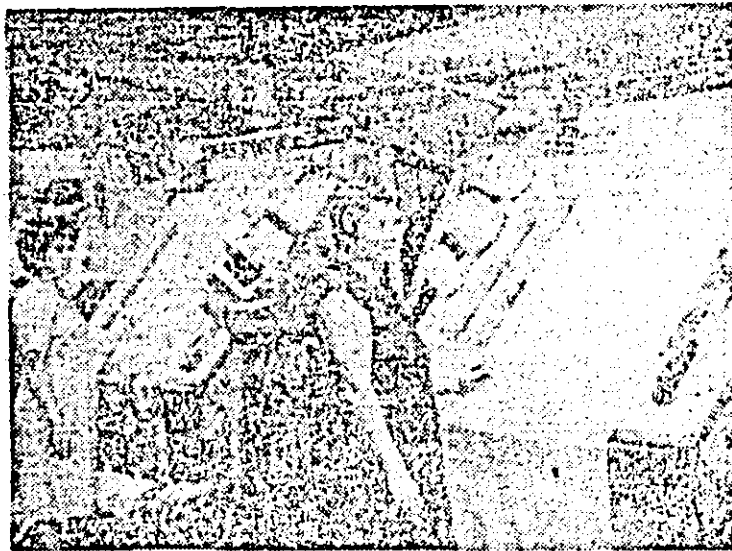
În secția finisaj a întreprinderii textile se efectuează un riguros control al calității țesăturilor.

Întreprinderea de vagoane. Se lucrează la înfișajul unui nou lot de vagoane destinate unor beneficiari de peste hotare.