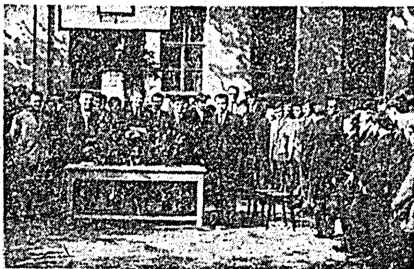
Liceul de construcții civile și-a început activitatea