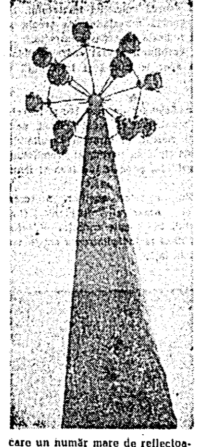
care un număr mare de reflectoare orientate pe spațiul pieței. Vă prezentăm în imaginea alăturată, primul stilp de acest fel pe care au fost montate deja corpurile de iluminat.

Piața gîrli din municipiul Arad va fi iluminată într-un mod deosebit: stilpi înții vor susține fie-