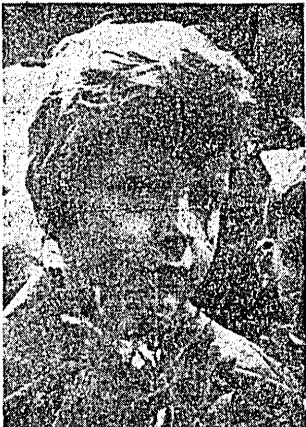
Am împlinit 6 ani...