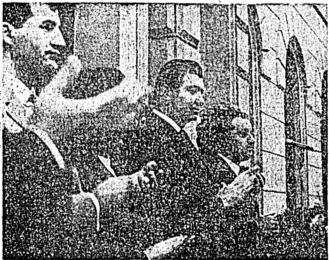
La festivitatea de la Liceul „Ioan Slavici”

Cu acest prilej, directorii școlilor, reprezentanții al U.T.C. și ai organizației de pionieri și-au luat angajamentul, în numele cadrelor didactice și al elevilor, să ducă la îndeplinire cu cinste sarcinile ce le stau în față.