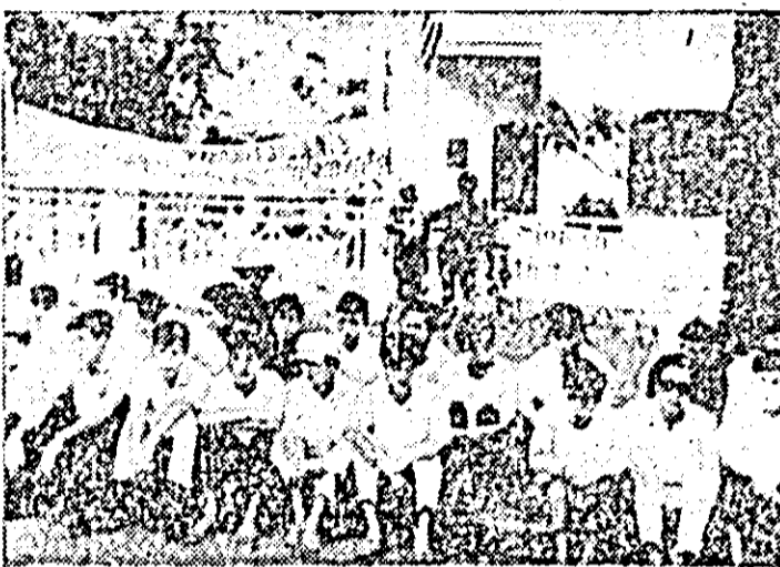
Continuă, cu amploare crescînd, demonstrațiile antiguvernamentale și anti-americane de la Saigon, Hue și alte localități sud-vietnameze. Imaginea de mai sus înfățișează un grup de studenți, care au declarat greva foamei, stînd în fața consulatului american din Hue, în semn de protest față de politica americană în Vietnam.

Într-o declarație dată publicității în ziarul „New York Times“, conducerea noii organizații cheamă pe toți adversarii agresivității SUA în Vietnam să se unească într-o „forță politică reală“.