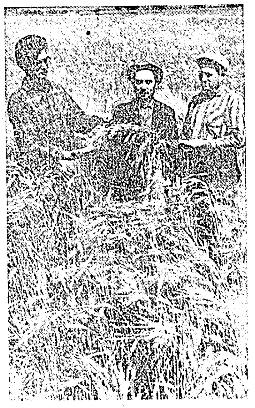
La Mănăștur, lanurile de orz sînt controlate zilnic pentru a se urmări stadiul de coacere, și a se stabili momentul optim de începere a recoltatului.