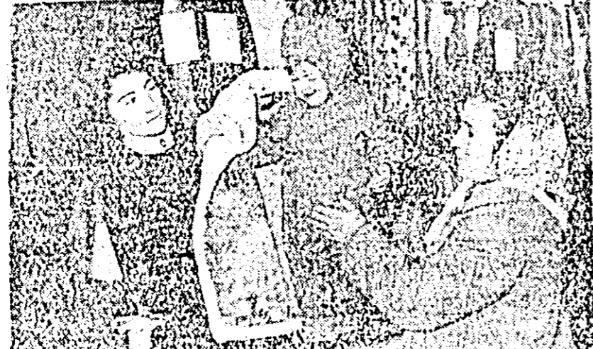
Blana este cam mare, însă ea o va apăra de frig pe viitoare el proprietară.