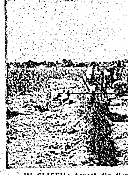
ÎN CLISEU: Aspect din timpul săpăturilor arheologice de la „Șanțul Mare”, coșuna Rovine, raionul Pecica.

3. Substratul dacic s-a semnalat mai multe nivele de locuire, toate aparținînd fazei timpurii și mijlocii a epocii bronzului (circa 1800—1200 înaintea erei noastre). Ele aparțin culturii cunoscute în literatura arheologică sub denumirea de cultura Periam—Pecica. În unele locuri pentru a ajunge la pămîntul viu, s-a coborît pînă la 4,5 m adîncime. S-au găsit numeroase fragmente ceramice, vase întregi de diferite forme.