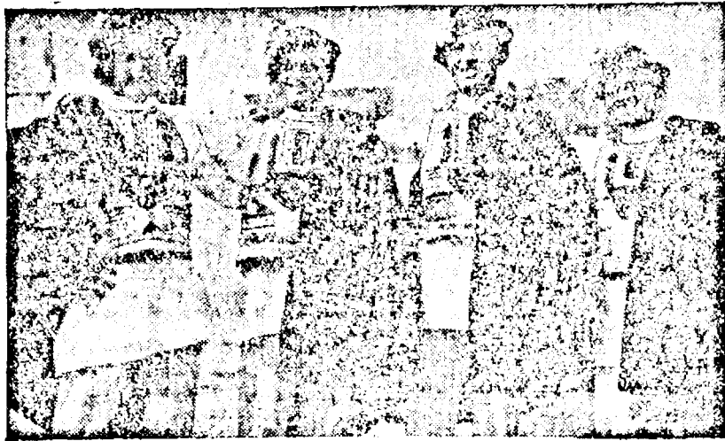
Flăcăi din Ardeal