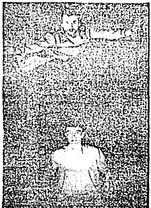
Secvență din spectacolul cu piesa „Traversarea Niagarei“ de A. Alegria.