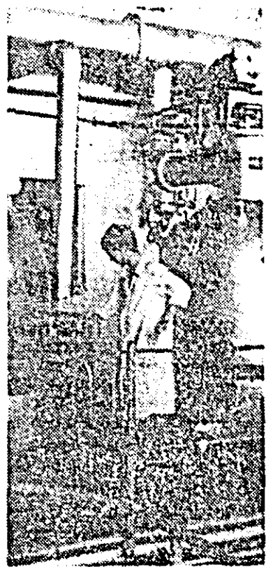
În actualul sezon la fabrica „Refacerea” se desfășoară din plin procesul de fabricație al conservelor și preparatelor din fructe și legume. În structura produselor de legume, o pondere o deține tomatele. Vă prezentăm în imaginea de față o secvență de muncă din secția de fabricare a pastei de roșii.

În urma controlului efectuat pe teren de către specialiști s-a ajuns la concluzia că începând cu data de 15 septembrie se poate trece la recoltatul sfecele de zahăr. Evident, acțiunea a început și se desfășoară conform graficului întocmit de comun acord între Fabrica de zahăr și unitățile cooperatiste contractante. Astfel, cooperativele agricole din Siria, Sintana și alte locuri au început primele care au început recoltatul mecanic al sfecele de zahăr. După cum am fost informați până acum pe județ din cele 8889 hectare s-au recolat peste 200 hectare, acțiunea fiind în plină desfășurare. De remarcat că în poziția condițiilor climatice dificile din acest an, producția se dovedește a fi bună. În multe unități ca bunăoară în cele din Iratoș, Dorobanți, Șimand, Satu Mare, depășind pe cea planificată inițial.