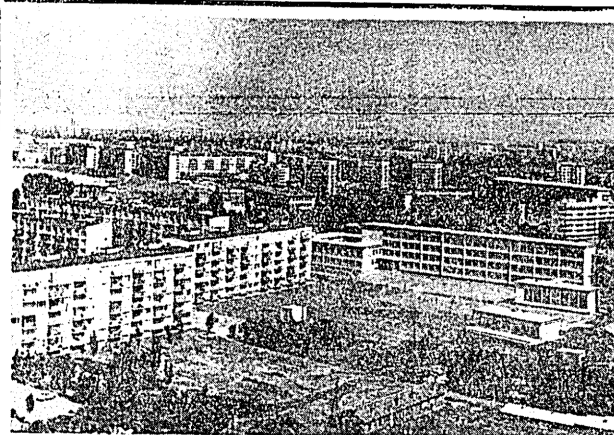
R. P. BULGARIA. În foto: Vedere panoramică asupra unui nou cartier rezidențial din partea de sud a orașului Sofia.

De asemenea, pentru prima dată, suedezi vor alege, tot la 20 septembrie, consilierii provinciali și municipali pe o perioadă de patru ani.