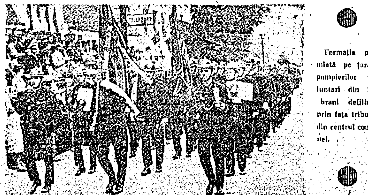
Formația premiată pe țară a pompierilor voluntari din Zăbrani defilînd prin fața tribunalului din centrul comunei.

În sula căminului cultural, fanfarele formațiilor de pompieri s-au întrecut de asemenea într-un plăcut și foarte atrăgător concurs muzical. Festivitatea de la Zăbrani închinată Zilei pompierilor din Republica Socialistă România a continuat, în orale după-amiezii, cu o frumoasă serbare etimpească, iar seara cu tradiționalul bal al pompierilor.