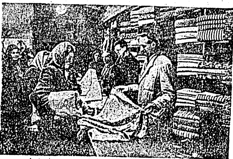
IN CLIȘEU: Gospodină făcînd cumpărături în magazinul O.C.L. „Produse Industriale” nr. 39.

Exemplul brigăzii a fost urmat și de ceilalți muncitori din sectorul vagonaj. În scurt timp au luat ființă 8 brigăzi de economii. Succesele obținute de aceste brigăzi sînt mari. Numai în decurs de 4 luni, muncitorii brigăzilor au obținut economii de materiale în valoare de peste 120.844 lei.