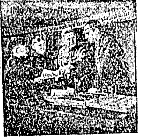
In secția lăcătușerie a Școlii medii nr. 69 din Astrahan, elevii sînt instruiți a învăța meseria.

Pentru a asigura nevoile de omîni de lucru ale diferitelor ramuri ale industriei, a fost creată o rețea largă de școli pe lângă fabrici și uzine.