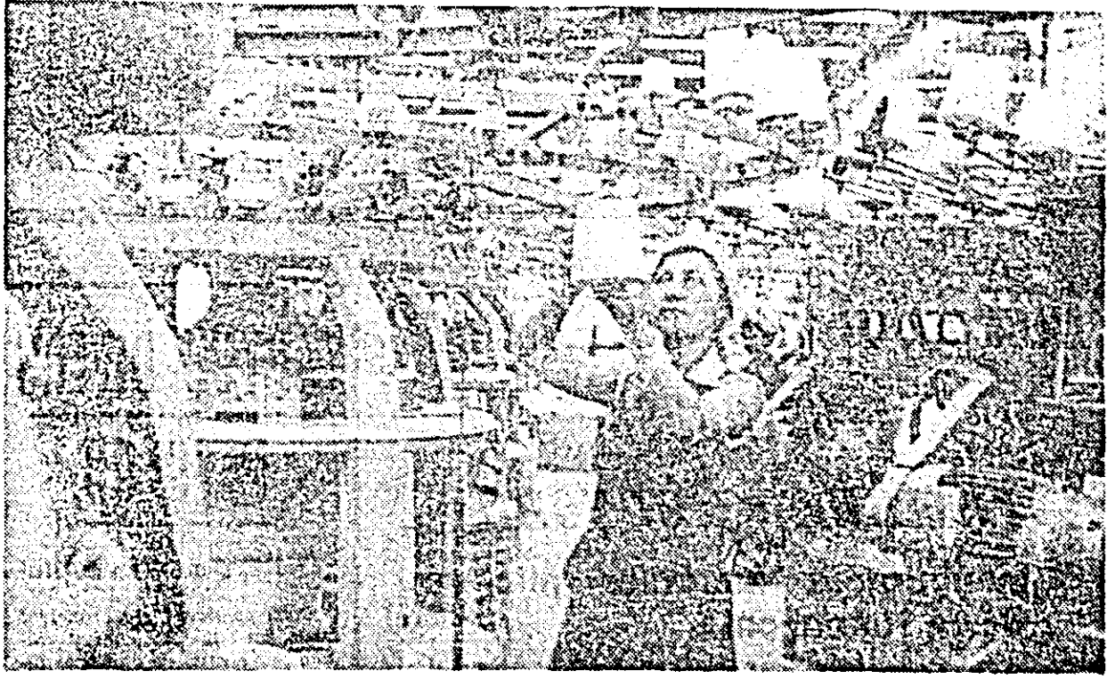
Aspect cotidian de muncă la fabrica „Tricolor” în clădirea „Interlock”. Evidențiată în întrecere.