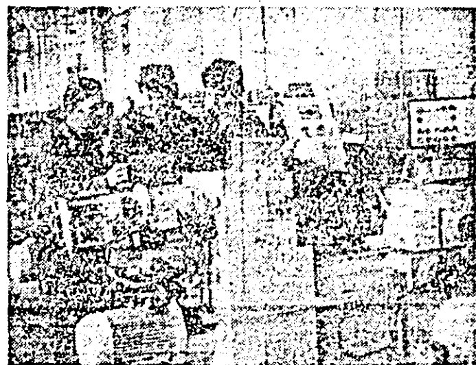
Aspect de muncă în atelierul montaj al I.M.U.A.