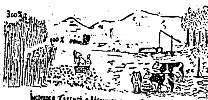
Încălzirea cu apă a pășunilor în ce în condiția să-ți crească...

Folosirea mustului de bălegar ca îngrășămintă dă rezultate foarte bune,