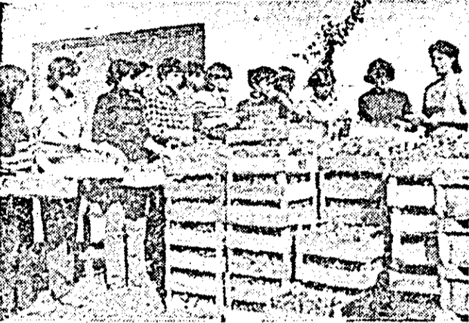
Elevi de la Liceul economic și de drept administrativ Arad, au participat la recoltatul strugurilor la ferma nr. 4 a I.A.S. Șagu.

Și în săptămîna trecută tinerii arădeni au acționat cu hotărîre pentru strîngerea și depozitarea recoltelor. În acest sens ni s-a semnalat: