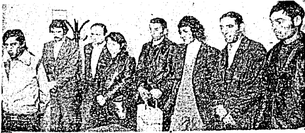
Este grupul de jecmanitori care au furat porumb de la ferma nr. 7 Horia a I.A.S. Ulviș.