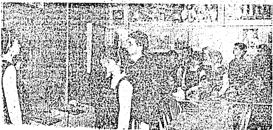
Una dintre cele mai reușite manifestări ale organizației U.T.C. din clasa a X-a A de la Liceul Industrial nr. 12 Arad a fost dezbaterile cu tema „Știința și religia” care a avut loc recent la Laboratorul de educație materialist-științifică

La acestea se alătură, desigur, activitățile cu o tematică vizind direct acest obiectiv al educației comuniste a liceului. De altfel, dosarul conținând referatele prezentate de membrii cercului de educație materialist-științifică reliefează seriozitatea și interesul cu care au fost abordate temele pre-