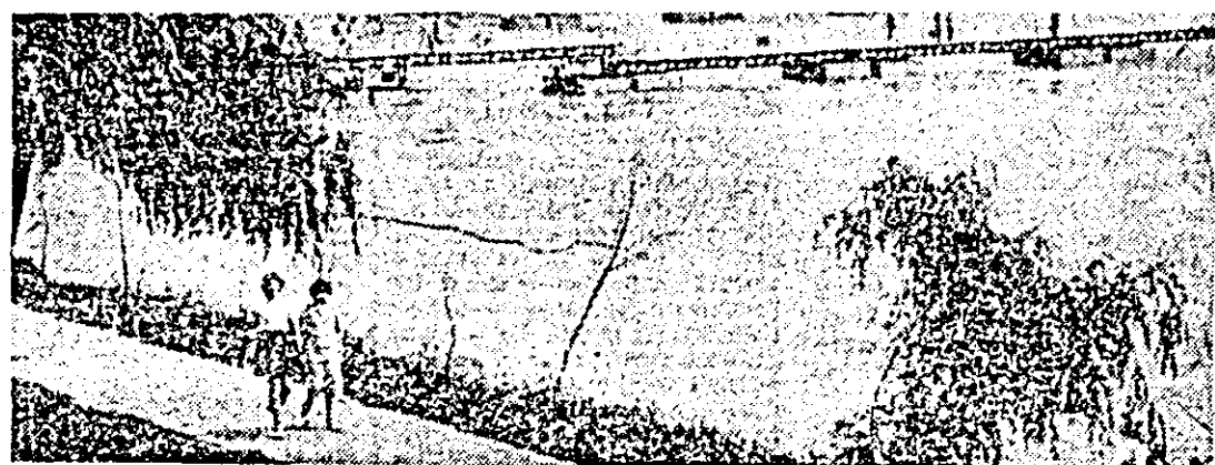
Laleza Mureșului, primăvara.