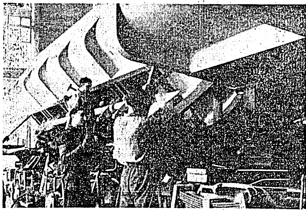
ÎN CLIȘEU: un aspect de muncă din secția finisaj a Uzinelor de vagoane. Se fac ultimele lucrări la un nou lot de vagoane basculante.