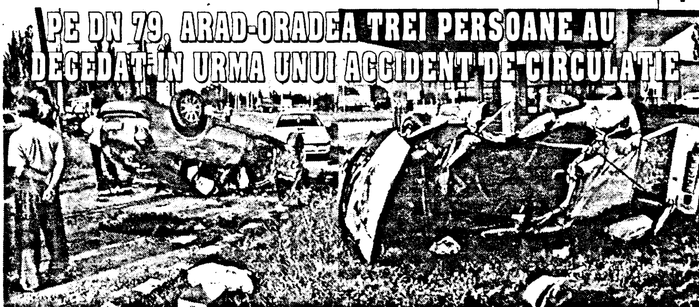
● Alte trei, în stare gravă, sunt internate la Spitalul Județean Arad