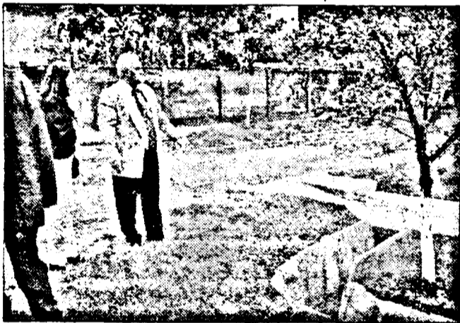
Dacă toți locuitorii ar avea rigolele îngrijite, inundațiile nu s-ar mai produce