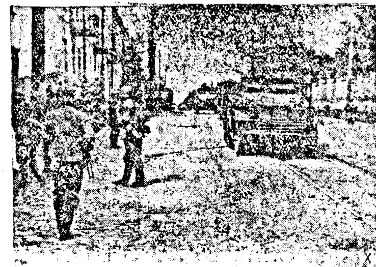
Orașul Minsk du- pă ocuparea sa de trupele germane.

În mod oficial se declară că Japonia va lichida relațiile ei comerciale cu An- glia și Statele Unite și ca ea va adânci în schimb raporturile ei de comerț cu țările din blocul yenului și cu acele care s'au declarat solidare cu ideea spațiului vital economic al extremului orient.