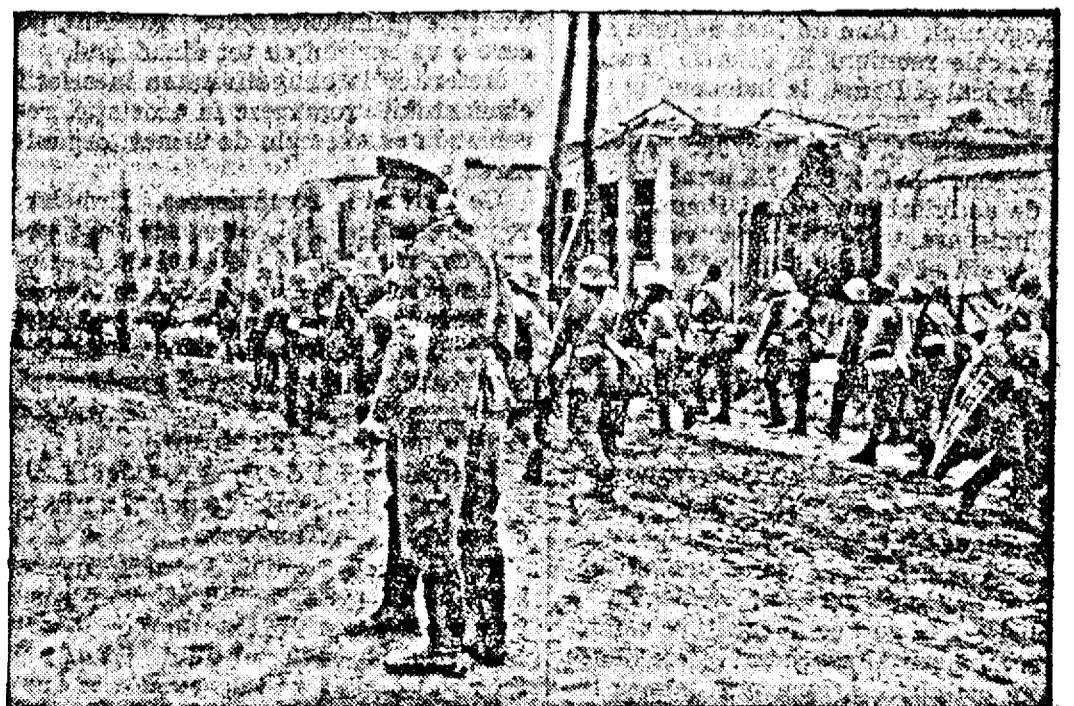
Soldații români în marș prin Basarabia.

Ambasada Germaniei la Buenos-Aires a protestat energic pe lângă guvernul argentinian contra acestui violări flagrante a dreptului internațional și a cerut să i se înapoieze sacii diplomatici în chestiune.