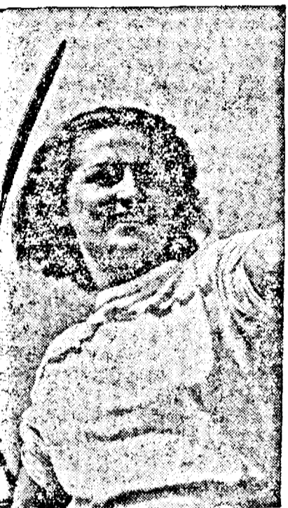
o tânără sportivă germană