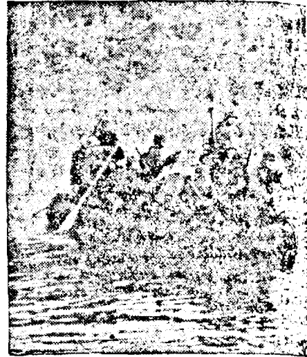
Soldați germani trec un râu în Lituania

Stăruind asupra sentimentelor anti-intervenționiste ale catolicilor din America de Nord, Arhiepiscopul a avertizat congresul și guvernul că nici odată nu ar ierta crima ce s'ar săvârși dacă Statele Unite ar fi implicate în războiul actual ale cărui baze sunt pur economice.