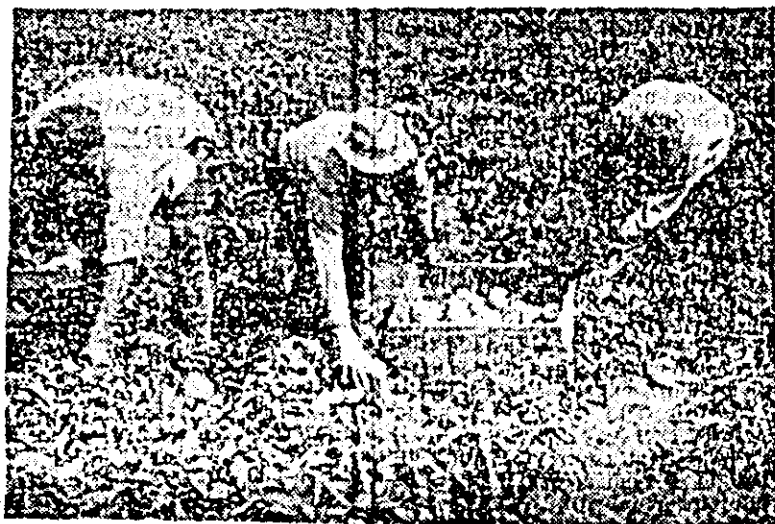
În grădina de legume a cooperativei agricole din Semlac se recoltează ardeul gras.