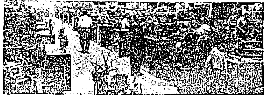
Secția scularie de la sectorul I a întreprinderii de vagoane, de unde vă prezentăm această imagine, își aduce o prețioasă contribuție la buna desfășurare a procesului de producție.

■ Măsurile stabilite, crîmpeie de viață ■ De ici de colo ■ Sport ■ Mica publicitate.