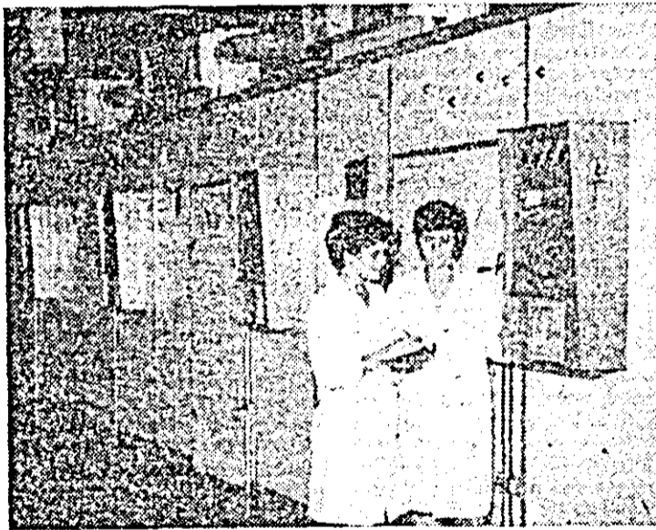
Aspect din hala de incubatoare a întreprinderii de stat „Avicola”.