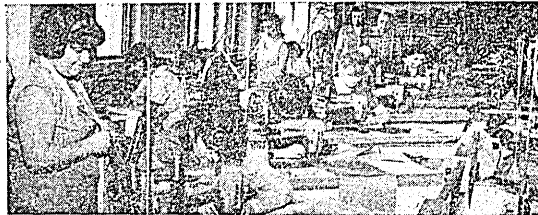
Secvență de muncă din secția I a Întreprinderii de confecții.