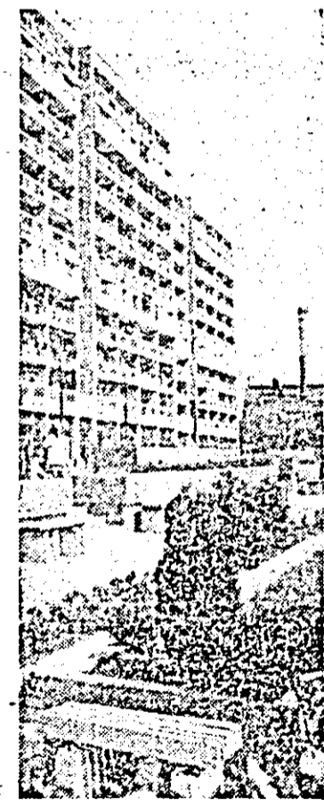
An de an, Aradul devine un oraș tot mai frumos, mai bine gospodărit.

Îi rugăm pe cititorii noștri care se adresează „Curierului Juridic”, să nu ne pună întrebări din domeniul diferite în aceeași scrisoare. Pot folosi mai multe file, fiecare conținînd întrebările dintr-un anumit domeniu al legislației. Rubrică realizată de: GIL NICOLAIȚA