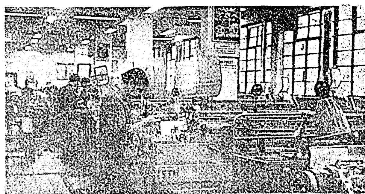
Strungurile automate cu care este înestrată fabrica de ceasuri „Victoria” asigură, la un nivel calitativ corespunzător, întreg necesarul de repere ale întreprinderii.

CITITORI! Asigurați-vă din timp abonamentele la ziarul „Flacăra roșie” pentru anul 1970