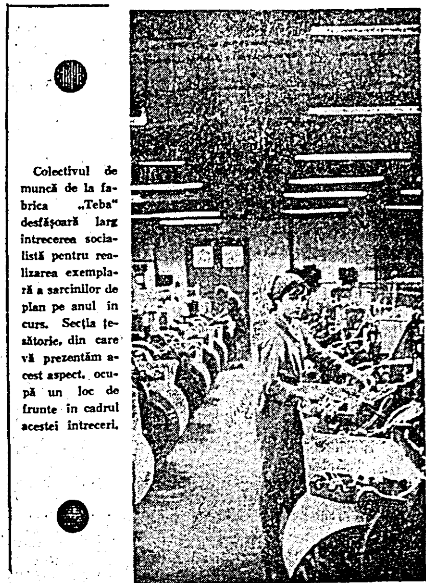
Colectivul de muncă de la fabrica „Teba” desfășoară larg întrecerea socialistă pentru realizarea exemplară a sarcinilor de plan pe anul în curs. Secția țesătorie, din care vă prezentăm acest aspect, ocupă un loc de frunte în cadrul acestei întreceri.

Numele este cu adevărat pe măsura zilelor noastre, zile ale cuceririi cosmospulii. Numele acesta este cu adevărat pe măsura îndrăznețelor visuri ale virstei de aur a copilăriei! Sugerează deopotrivă nostalgia și mirajul chemării spre vastități neștiute, cit și îndrăzneala — puterea de nestăvilit a voinței — de a le atinge. Acest nume îl poartă echipajul pionieresc al județului Arad care își încearcă măiestria, perspicacitatea, bogăția și temeinicia cunoștințelor cu ale altor echipaje din țară.