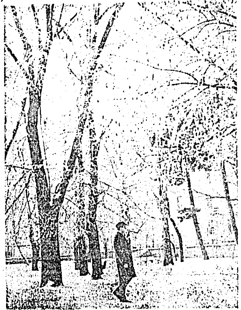
Jarnă.