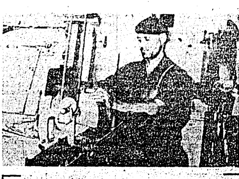
Instalarea în atelierele fabricii de cherestea Bocșji. Se execută ascuțirea pinzelor pentru gater.

Cu toate că în multe unități a început strîngerea primilor știuleți de porumb, campania de recoltare