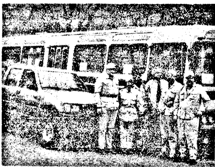
Un nou convoi încărcat cu ajutoare materiale a sosit la Arad din partea Crucii Roșii din Cehoslovacia.