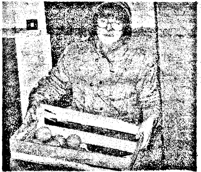
La autoservirea Fortuna (Calea A. Vlaicu) sesizările cetățenilor s-au confirmat: nu toate portocalele primite au fost puse în vânzare.

La întoarcere, echipajul poliției îndrumă spre locurile de destinație un convoi cu ajutoare umanitare sosite din Franța. Întîlnim echipe de ordine formate din ofițeri, subofițeri de poliție și militari — sînt 20—52 de asemenea echipe în fiecare noapte — care se află la posturi, patrulînd alții în zona centrală cît și în cartiere.