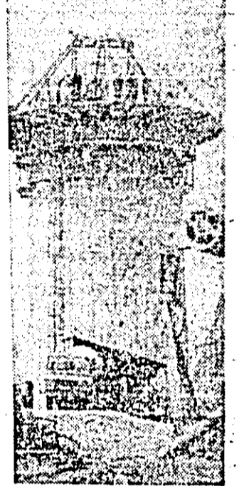
Coșul de fum își continuă ascensiunea spre cota finală de 160 metri.