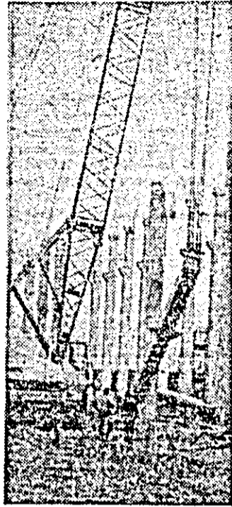
Au început și continuă intens lucrările și la stația de conexiuni de 110 kV.