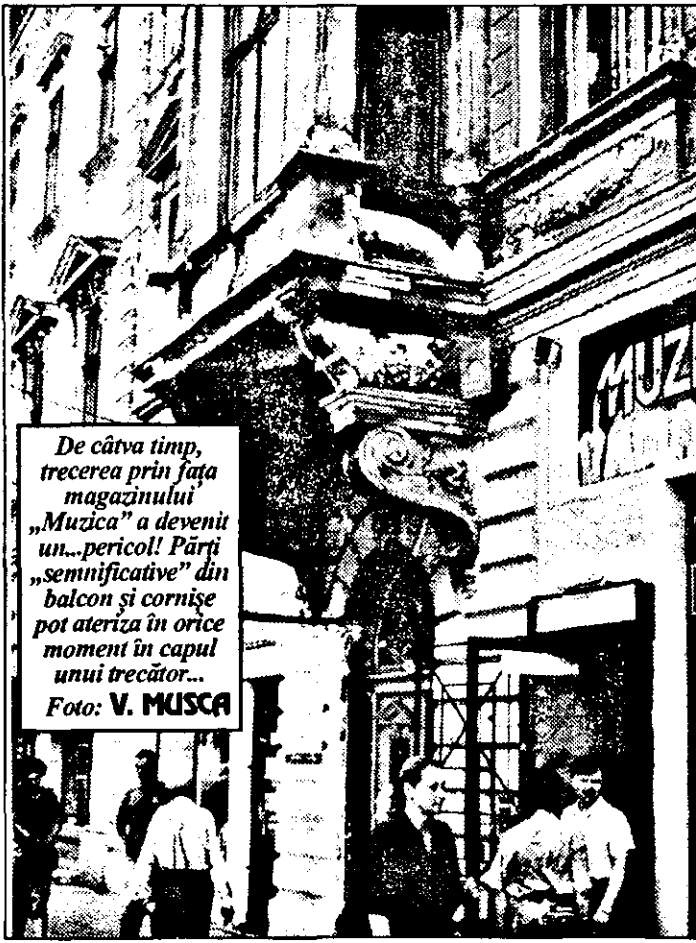
De câțiva timp, trecerea prin fața magazinului „Muzica” a devenit un... pericol! Părți „semnificative” din balcon și cornișe pot ateriza în orice moment în capul unui trecător...