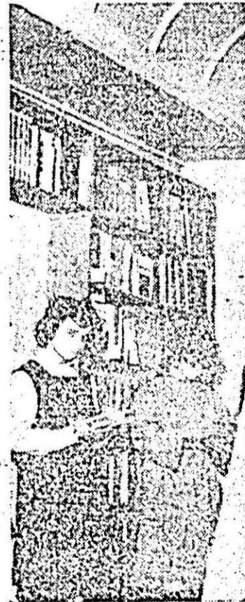
Aspect din librăria „Minerva” mutată într-un nou sedlu în Piața Avram Iancu.