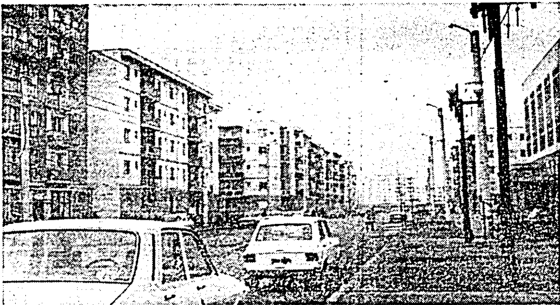
Noul construcții de locuințe în municipiul Arad.