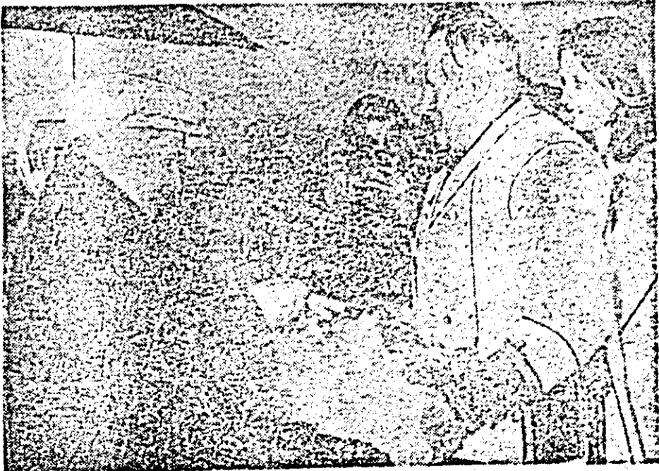
La sosirea în Arad, iubitul conducător este întâmpinat după tradiție.

Manifestarea va fi transmisă direct de posturile de radio și televiziune, în jurul orei 11.30.