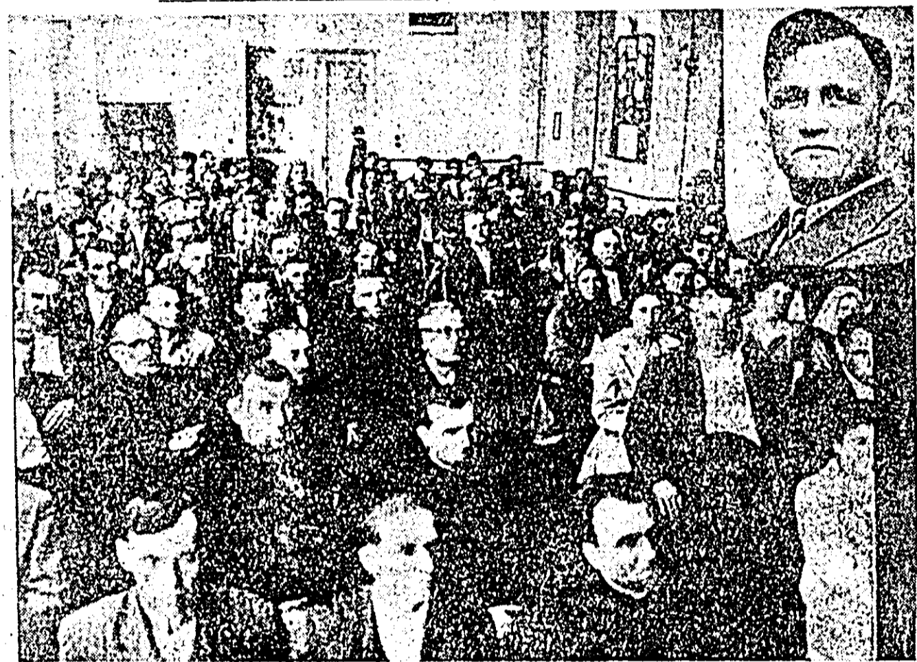
Aspect de la Conferința raională a comitetului de luptă pentru pace. Citii în pagina a 3-a lucrările conferinței.