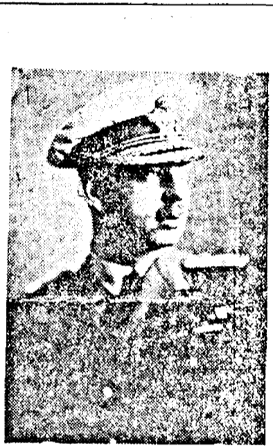
REGELE CAROL II consolidatorul României moderne

aflăm cu mult rămas în urma celorlalte neamuri luminate, cu școli vechi de pe vremea pe când noi ne apărăm în codri de hoare. De tărești și călăuzi, Măria Sa Regele Carol al II-lea a înțeles că dela scaunul Domniei trebuie să vie îndemnul și ajutorul.