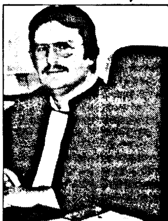
gisiției naționale cu acesta.

■ Ca specialist pot afirma că interesul pentru această nouă facultate și specializare este pe deplin justificat. Inițiativa înființării acestei facultăți corespunde unei necesități și anume aceea că România să dispună de specialiști necesari pentru a-i utiliza în procesul de preaderare și aderare la Uniunea Europeană. Este evident, intrarea noastră ca partener al comunităților europene presupune cunoașterea dreptului european, în scopul armonizării și compatibilizării le-