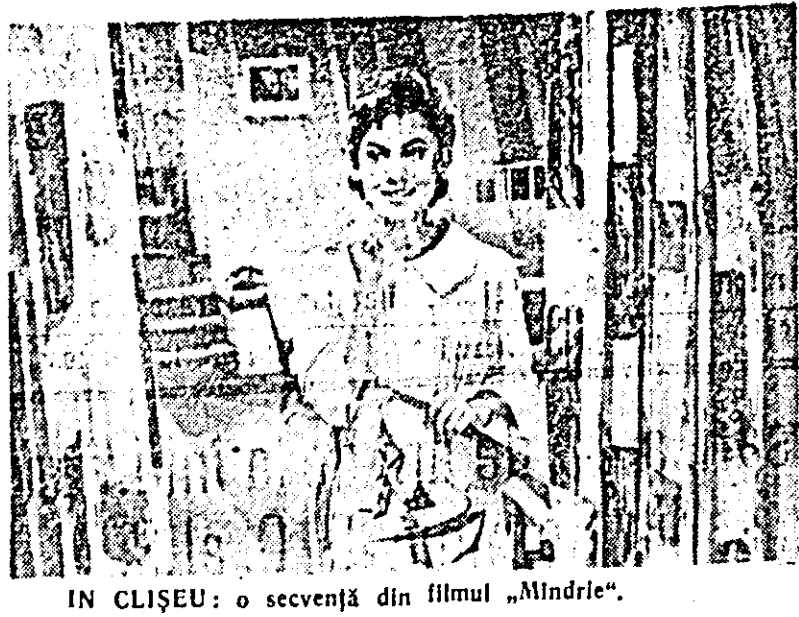
ÎN CLIȘEU: o secvență din filmul „Mindrie”.

Rezumatul în limbile rusă, franceză și engleză ale principalelor studii și referate.