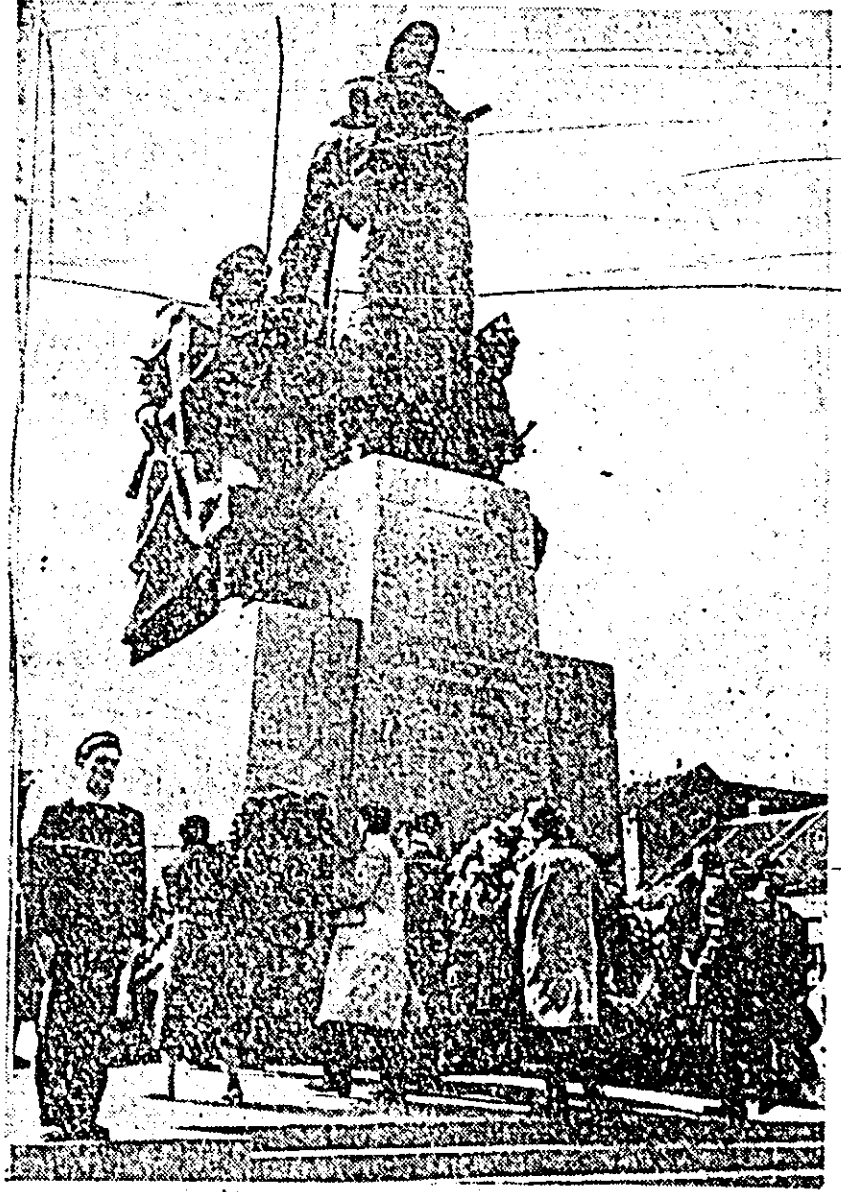
La sărbătorirea zilei de 9 Mai, ziua Independenței de stat a Romîniei și a victoriei asupra fascismului german, numeroși reprezentanți ai oamenilor muncii din întreprinderile și instituțiile arădene, au depus la monumentul Eroilor patriei numeroase coroane de flori.