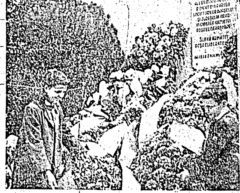
Flori, multe flori, iată cum au cinstit oamenii muncii din orașul Arad memoria ostașilor romîni și sovietici care s-au acoperit de glorie în luptele pentru eliberarea patriei noastre de sub jugul fascismului german. IN CLISEU: pionierii, alături de celelalte delegații ale oamenilor muncii depun, cu recunoștință și respect pentru memoria ostașilor sovietici care și-au jertfit viața pe cîmpul de luptă, frumoase coroane de flori la monumentul Eroilor sovietici din fața gării CFR Podgoria.