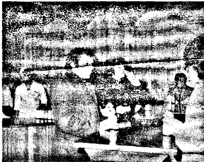
Zilnic, pentru micul dejun (și nu numai) magazinul „Moca” oferă solicitanților sana și chiule.