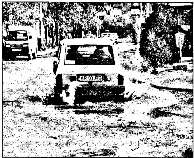
Nu, nu sunt inundatii, e apa pluvială ce n-are loc în sistemul de canalizare!

Apa de ploaie inundă întreg carosabilul și ajunge la porțile oamenilor ce locuiesc aici. Chiar și tramvaiele nu mai circulă atunci când nivelul apei depășește 30 cm. Transportul în comun făcându-se în astfel de cazuri cu ajutorul autobuzelor. Exemplele ar putea continua (din păcate). De-acum nu mai pot veni decât ploii, lapoviță și ninsoare. Deși e târziu, încă mai așteptăm ca edilii noștri să se trezească din amorteală, să pună mâna pe mătură, să curețe gurile de canal și să facă în așa fel încât urbea noastră să nu mai arate precum un „târg” de provincie. Oare, în numărăratele lor călătorii n-au observat, spre exemplu, cum arată străzile în Occident? Căci în majoritatea cazurilor s-au ales spre