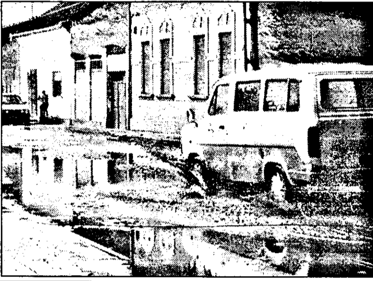
Din baltă-n baltă...

sabilul. Lucrurile stau la fel și în fața pieței Fortuna. Pietonii sunt obligați să sară peste bălțile ce stau la intrarea în piață, situație ce predomină și în P-ța UTA colț cu intrarea în cimitirul Eternitatea. Aici, de pildă, un canal aproape