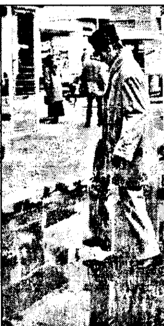
La Piața Fortuna se ajunge în salturi

Ne inundă apele... pluviale Trecând prin zona stației CFR, pe marginea drumului, bălțile inundă întreg caro-