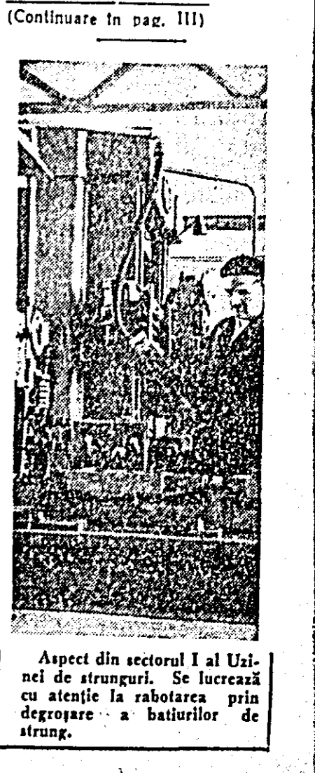
Aspect din sectorul I al Uzinei de strunguri. Se lucrează cu atenție la rabotarea prin degroșare a batiurilor de strung.