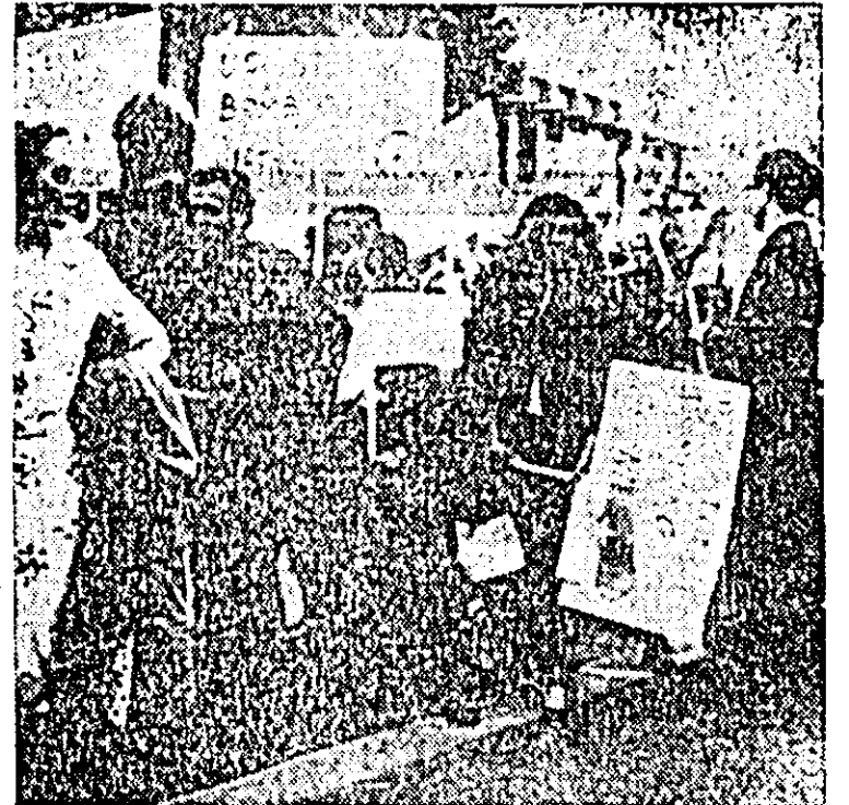
Aspect de la o recentă demonstrație care a avut loc la Londra. Participanții au protestat împotriva războiului din Vietnam.

Duminică dimineața, precează agenția, patrioții au declanșat opt acțiuni simultane asupra unor posturi militare saigoneze situate la numai 35 kilometri de capitala sud-vietnameză, provocând pierderi importante trupelor guvernamentale.