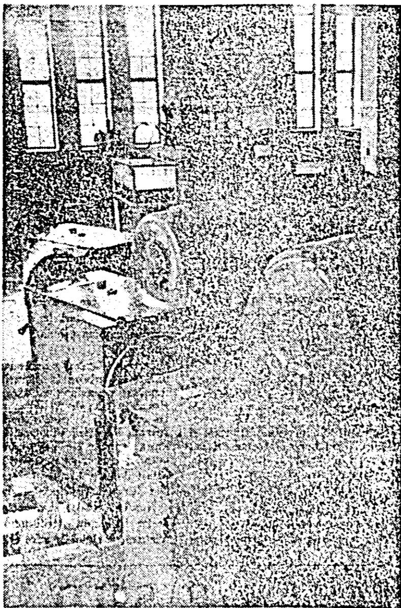
Uzina de apă. Aspect din sala mașinilor