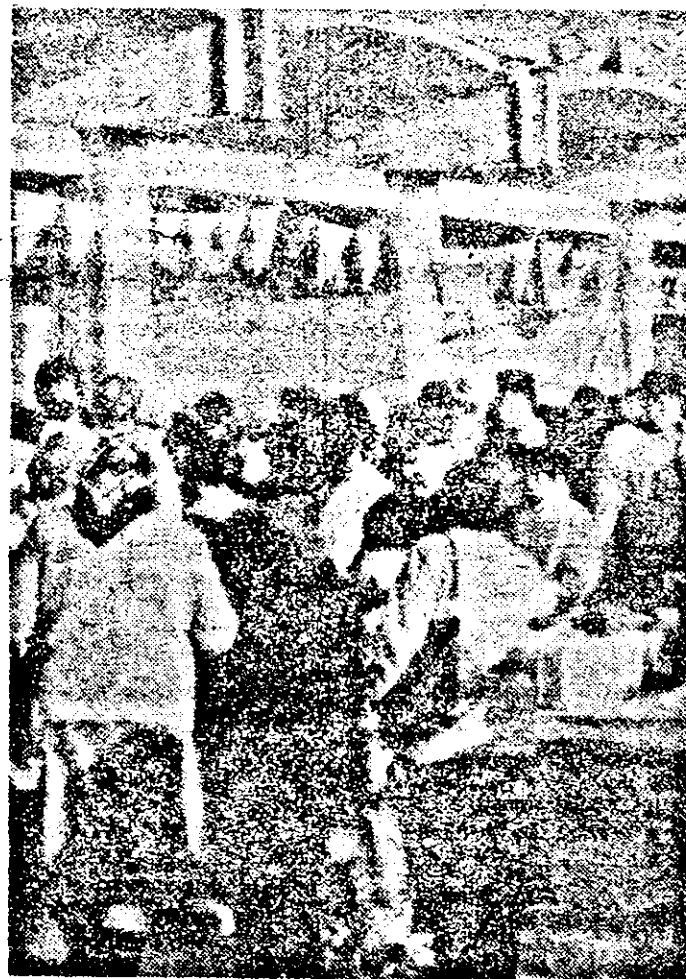
„Lumeee, lumeee...” (S-a deschis Tîrgul de toamnă al Cooperăției meșteșugăreșii).