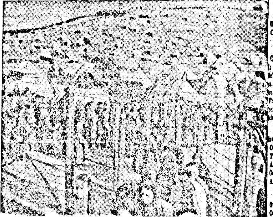
Un lagăr de concentrare englez în marele film: „Răscoala Burilor” Emil Jannings

Noua producție franceză va fi difuzată în țară de marea casă de filme O. C. R. (Oficiul Cinematografic Românesc).