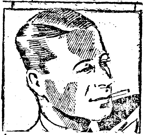
A tökéletes frizura előkelő és hódító megjelenést kölcsönöz Önnek