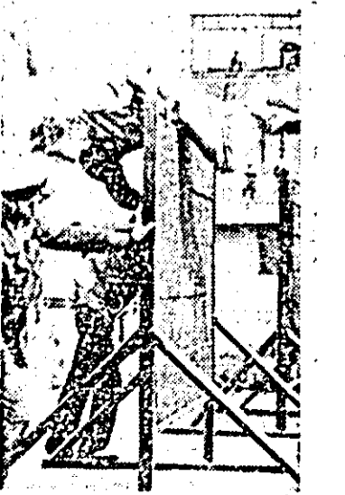
Aspect din timpul desfășurării concursului între formațiile civile de pompieri.