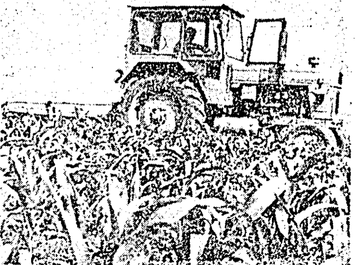
Întreținerea mecanică a porumbului la C.A.P. Gramiceni.