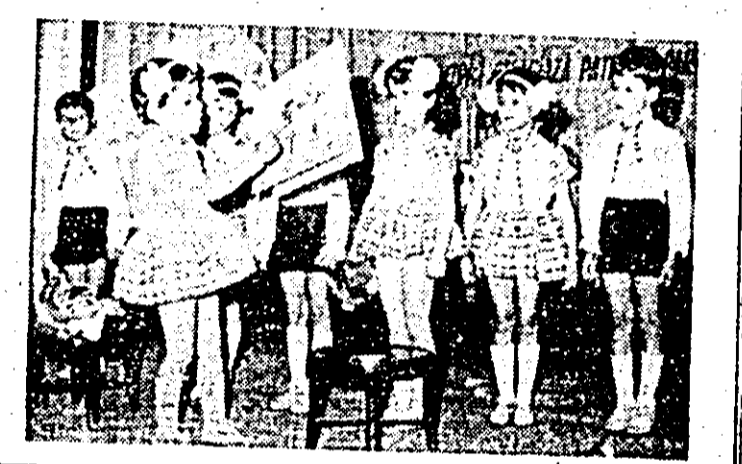
Brigada artistică a Grădiniței P.P. Sere în spectacolul „Șoimii patriei cîntă patria și partidul” desfășurat la C.P.S.P. Arad.

de tineri în spiritul materialismului dialectic și istoric, necesitatea organizării pe această linie a unor acțiuni variate, bogate în conținut, atractive. • La nivelul comitetului U.T.C. de la întreprinderea de mașini-unelte Arad a fost organizat un schimb de experiență pe tema „Proapaanda vizuală în sprijinul realizării sarcinilor de plan și creșterii eficienței economice la fiecare loc de muncă”. • Dezbaterea „Istoria patriei — sursă nesecată de inspirație pentru creația artistică”, găzduită de Clubul tineretului Arad, la care au participat numeroși tineri din întreprinderile școli, instituții, a evidențiat însemnătatea cunoașterii și însușirii marilor idealuri ale poporului român — neaflinare, pace, progres și prosperitate — a cultivării patriotismului socialist, a dragostei față de popor și țară, sentimente care trebuie să se rezească în operele scriitorilor și poetilor noștri.