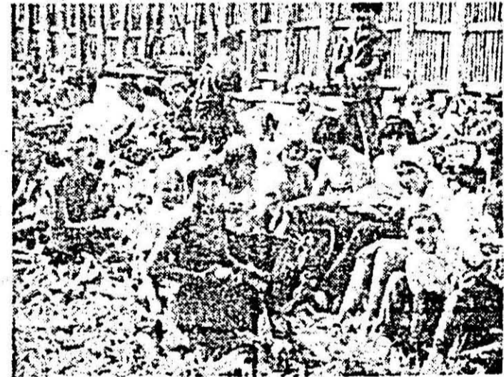
Foto 3: E toamnă, și vesella copiilor din Pîncota merge mîna în mîna cu munca!

Desigur că nu vrem să insinuăm nimic nici măcar de draul demonstrației în sine, cum că, vorba aceea „nici la slujbă, nici la drujbă”, că unii, sub pretextul sarcinii de a fi pe cîmp se află în cu totul altă parte. Dorim doar să semnalăm posibilele sustrageri de la o muncă de obște, de mare actualitate, dar și de tradiție. Nu ne referim doar la un control serios ci, mai ales, la o organizare bună, pe grupuri de oameni, pe tarlate precizate, pentru ca, în comun, cu disciplină și responsabilitate și rezultatele să fie vizibile, optime.