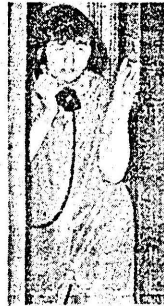
Foto 2: „Alo, tovarășe președinte? Au venit niște ziaristi! Ce să le spunem...?”

de roade tocmai bune de adunat. Ei bine, în preajma Covăsluiului, Cuvinului, Ghiorocului nu se mai arăta aceeași forțolă ca în localitatea precedentă. Iuștea fosfoare a