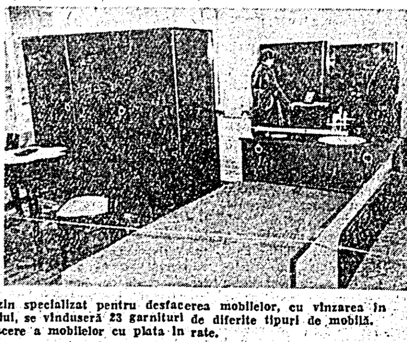
Recent, pe strada I. C. Frimu s-a deschis un nou magazin specializat pentru desfacerea mobilor, cu vânzarea în rate. Chiar din primele două ore de la deschiderea magazinului, se vînduseră 23 garnituri de diferite tipuri de mobilă.