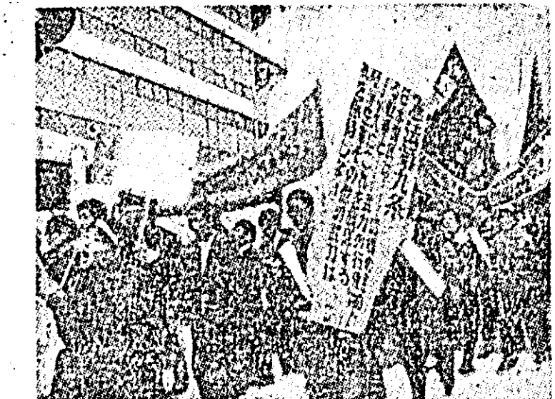
Aspect de la o recentă demonstrație deslășurată pe străzile orașului Tokio ca protest împotriva revizuirii constituției și pentru protecția drepturilor democratice. Participanții la demonstrație au protestat de asemenea împotriva acțiunilor agresive în Vietnam și intervenției armate americane din Republica Dominicană.

le de politică europeană comună. Va trebui să examinăm, de asemenea, sub ce formă țările din Europa occidentală, care nu fac parte din Piața comună, vor putea fi apropiate de această organizație. El a subliniat că după această etapă trebuie să se înceapă o apropiere Est-Vest printr-o strînsă colaborare economică. În ce privește NATO, Erhard a spus că „Statele Unite doresc, fără îndoială, ca președintele Franței să rămână fidel alianței nord-atlantice. Am avut această convingere în cursul întrevederilor mele cu președintele Johnson. Sintem deosebit de interesați în realizarea unității alianței occidentale, a spus el. Aș vrea însă să subliniez că noi nu vrem să jucăm un rol de mediator sau de arbitru în cadrul acesteia”. După ce a arătat că prietenia între Franța și Germania occidentală este „de o importanță vitală pentru cele două țări”, cancelarul vest-german a vorbit de posibilitatea unei apropieri Est-Vest.