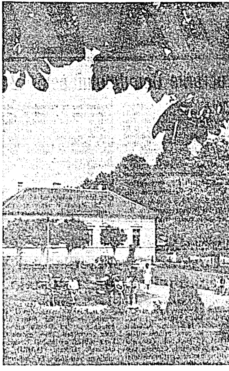
Parcul din mijlocul comunei a devenit un loc de plăcută recreere pentru locuitorii din Peregu Mare.