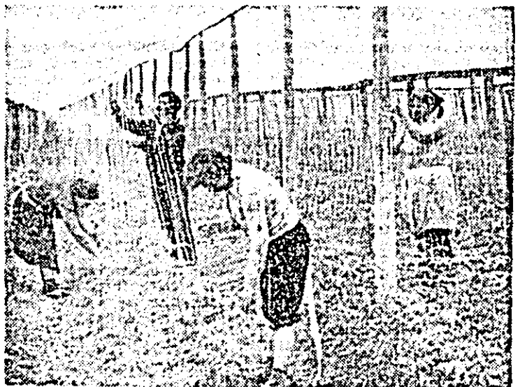
În ferma I a asociației legumicole Nădlac, se acționează de zor la copilul și legatul pe șallere a tomatelor.