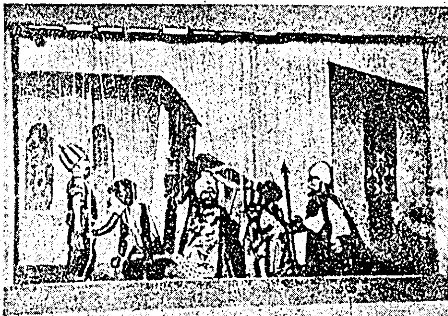
În cliceu: Un aspect din spectacolul „Aladin și lampa fermecată”.

Cele trei spectacole, care în prezent sînt în stadiul de finalizare vor fi prezentate la începutul stagiunii viitoare. Pe lângă această bucurie, micuții spectatori o vor avea și pe aceea de a fi primiți într-o sală nouă, frumoasă, unde la început vor afla vești despre păpușarii din toată lumea și vor avea surpriza multor nouități.