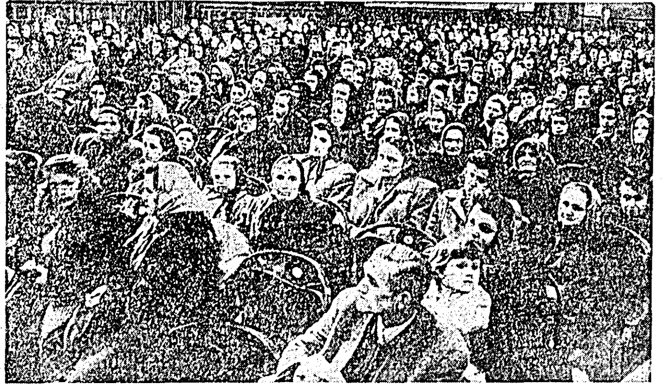
ÎN CLIȘEU: aspect de la mitingul oamenilor muncii din orașul nostru în cinstea alegerilor de deputați în sfaturile populare.