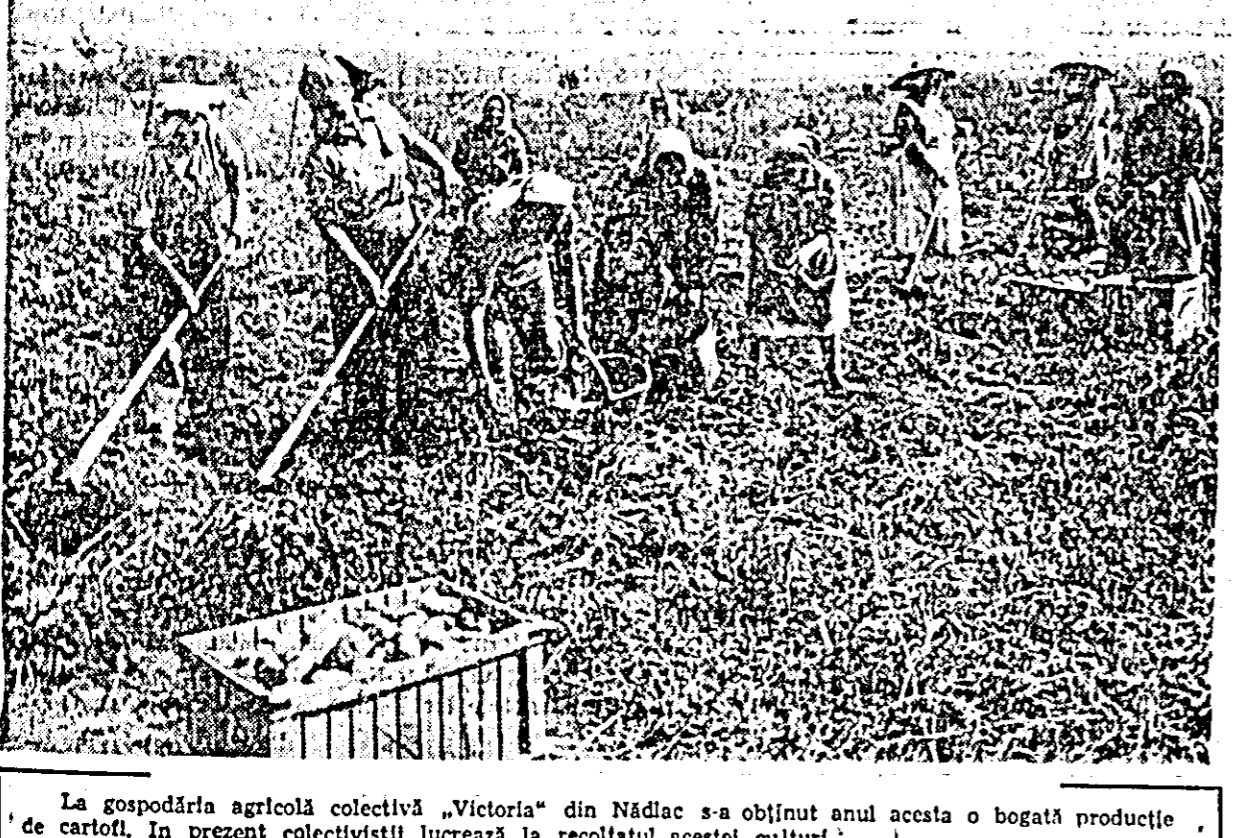
La gospodăria agricolă colectivă „Victoria” din Nădlac s-a obținut anul acesta o bogată producție de cartofi. În prezent colectivitățile lucrează la recoltatul acestei culturi. În clișeu: aspect de la culesul cartofilor.