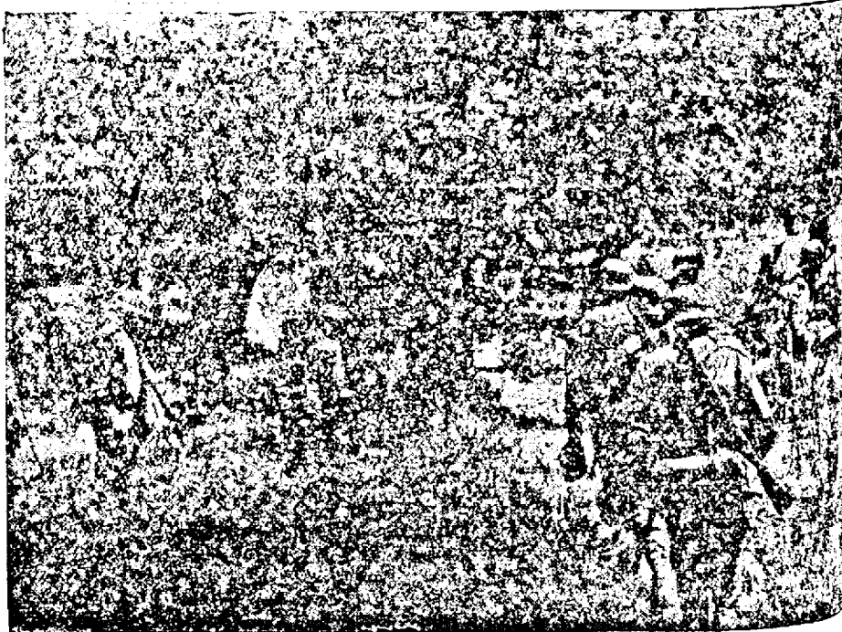
Vânători de munte germani înaltează printr-o pădure de măsline, în zona de Khania.

Ei execută o manevră extrem de atentă, deoarece neamurăriți vânători nici sunt plăsați în măsline de pe insulă.